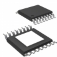
LTC3812IFE-5#TRPBF Linear Technology IC REG CTRLR BUCK 16TSSOP