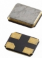
TSX-3225 48.0000MF18X-AJ Epson CRYSTAL MHZ SMD