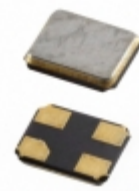
TSX-3225 48.0000MF10Z-B6 EPSON CRYSTAL 48.00 MHZ 16.0PF SMD