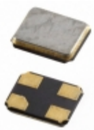
TSX-3225 48.0000MF10U-AJ3 EPSON CRYSTAL 48.00 MHZ 8.0PF SMD