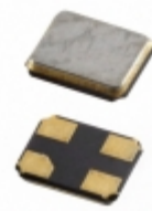
TSX-3225 48.0000MF10Z-B Epson CRYSTAL MHZ SMD