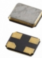
TSX-3225 50.0000MF15X-K Epson CRYSTAL MHZ SMD