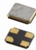
TSX-3225 50.0000MF15X-W Epson CRYSTAL MHZ SMD