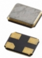
TSX-3225 49.1520MF15X-K Epson CRYSTAL MHZ SMD