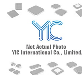
BA33C25-E2 ROHM BA33C25-E2 ROHM