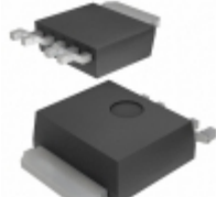
BA33C25FP-E2 Rohm Semiconductor IC REG LDO 3.3V/2.5V 1A TO252