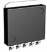
BA33C25HFP-TR Rohm Semiconductor IC REG LDO 3.3V/2.5V 1A HRP5