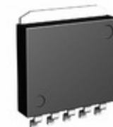
BA33D18HFP-TR Rohm Semiconductor IC REG LDO 3.3V/1.8V 0.5A HRP5