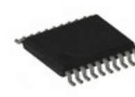
ATF16LV8C-10XU Microchip Technology IC PLD 8MC 10NS 20TSSOP