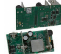
NCP1083WIRGEVB AMI Semiconductor / ON Semiconductor EVAL BOARD FOR NCP1083WIRG