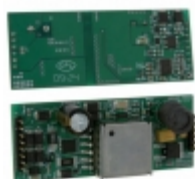
NCP1083QBCGEVB AMI Semiconductor / ON Semiconductor EVAL BOARD FOR NCP1083QBCG