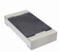
RC1206JR-076M2L Yageo RES SMD 6.2M OHM 5% 1/4W 1206