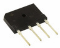
PB3510-E3/45 Electro-Films (EFI) / Vishay RECTIFIER BRIDGE 1000V 35A PB