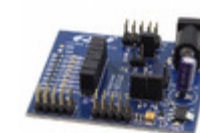
CP2120EK Energy Micro (Silicon Labs) KIT EVAL FOR CP2120