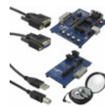
CP2114-WM8523EK Energy Micro (Silicon Labs) KIT EVAL CP2114-WM8523