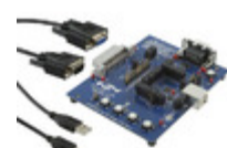
CP2114-EK Energy Micro (Silicon Labs) KIT EVAL CP2114