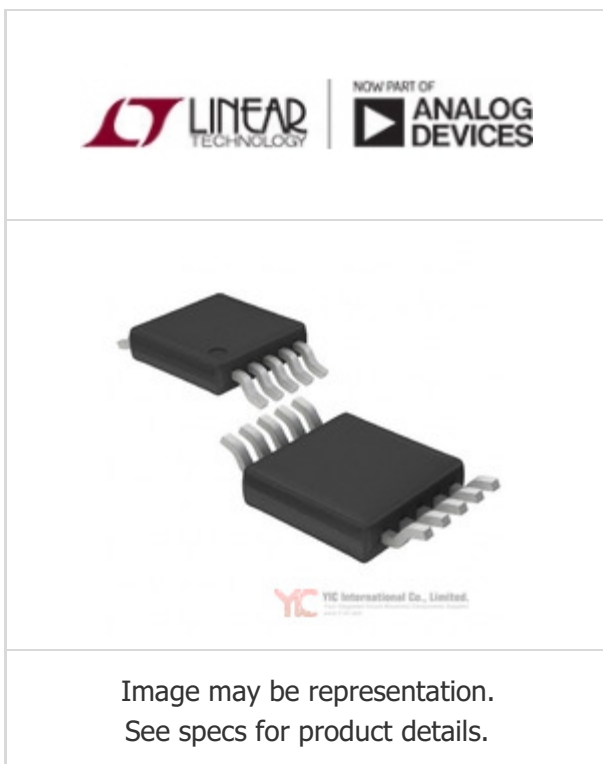
Image may be representation. See specs for product details.