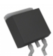
BA15BC0FP-E2 LeCroy (Teledyne LeCroy) IC REG LDO 1.5V 1A TO252-3