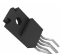
BA15BC0WT-V5 LAPIS Semiconductor IC REG LDO 15V 1A TO-220FP