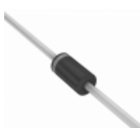
BA159GPHE3/54 Electro-Films (EFI) / Vishay DIODE GEN PURP 1KV 1A DO204AL