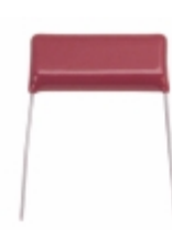
ECQ-E2125KS Panasonic Electronic Components CAP FILM 1.2UF 10% 250VDC RADIAL