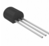
11LC161-I/TO Microchip Technology IC EEPROM 16KBIT 100KHZ TO92-3