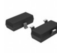
11LC161T-E/TT Microchip Technology IC EEPROM 16KBIT 100KHZ SOT23-3