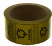
CLABEL2X2 SCS LABEL ESD/STATIC 2"X2" 500PC