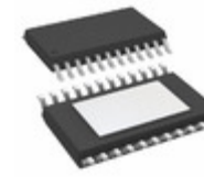
AD5420AREZ Analog Devices Inc. IC DAC 16BIT 1CH SER 24TSSOP