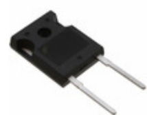
RHRG30120 AMI Semiconductor / ON Semiconductor DIODE GEN PURP 1.2KV 30A TO247