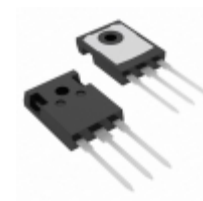
RHRG1560CC Fairchild/ON Semiconductor DIODE ARRAY GP 600V 15A TO247