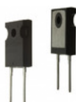
RHRG30120 Fairchild/ON Semiconductor DIODE GEN PURP 1.2KV 30A TO247