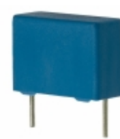
B81130C1104M EPCOS (TDK) CAP FILM 0.1UF 20% 275VAC RADIAL