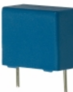
B81130C1154M EPCOS (TDK) CAP FILM 0.15UF 20% 275VAC RAD