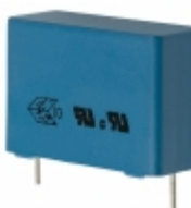
B81130C1105M EPCOS (TDK) CAP FILM 1UF 20% 275VAC RADIAL