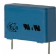
B81130C1334M EPCOS (TDK) CAP FILM 0.33UF 20% 275VAC RAD