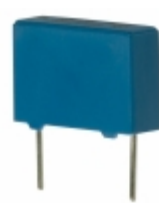
B81130C1153M EPCOS (TDK) CAP FILM 0.015UF 20% 275VAC RAD