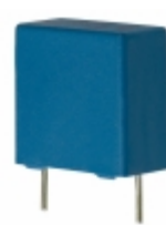
B81130C1224M EPCOS (TDK) CAP FILM 0.22UF 20% 275VAC RAD