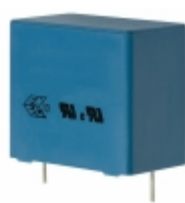
B81130C1225M EPCOS (TDK) CAP FILM 2.2UF 20% 275VAC RADIAL