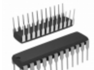
ATF22V10C-15PU Microchip Technology IC PLD 10MC 15NS 24DIP