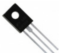
BD433S Fairchild/ON Semiconductor TRANS NPN 22V 4A TO-126