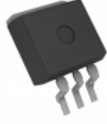
BD433M5FP2-CZE2 LAPIS Semiconductor IC REG LIN 3.3V 500MA TO263-3F