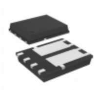
VS-8DKH02HM3/H Electro-Films (EFI) / Vishay RECT 8A 0.7V FRED PT FLATPAK 5X6