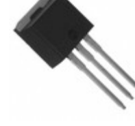
VS-8ETH03-1-M3 Electro-Films (EFI) / Vishay DIODE GEN PURP 300V 8A TO262AA