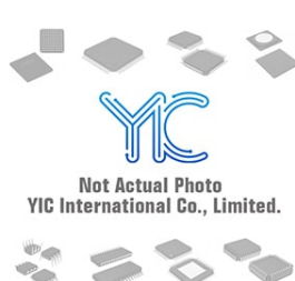
AT24C02A-10SU-1.8 AT- AT- SOP8