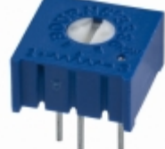
3386P-1-101 Bourns, Inc. TRIMMER 100 OHM 0.5W PC PIN TOP