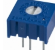
3386P-1-101LF Bourns, Inc. TRIMMER 100 OHM 0.5W PC PIN TOP