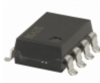
AQW612EHA Panasonic Electric Works RELAY OPTO AC/DC 60V 500MA 8SMD