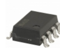
AQW610EHA Panasonic Electric Works RELAY OPTO AC/DC 350V 120MA 8SMD