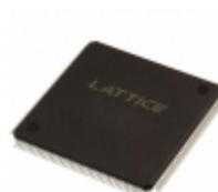
LC4512V-35TN176C Lattice Semiconductor Corporation IC CPLD 512MC 3.5NS 176TQFP