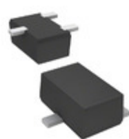
DSC5G0200L Panasonic Electronic Components TRANS RF NPN 20V 15MA SMINI3