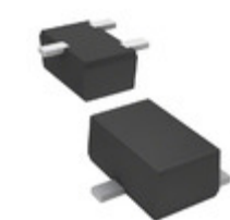
DSC5A01T0L Panasonic Electronic Components TRANS NPN 40V 0.05A SMINI3