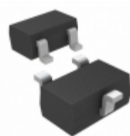
LM4050AEX3-2.5/V+T Maxim Integrated IC VREF SHUNT 2.5V SC70