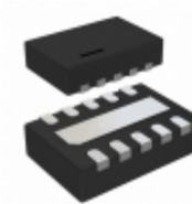
LT3592IDDB#TRPBF Linear Technology IC LED DRIVER RGLTR 50MA 10DFN