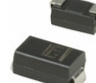
SMAJ85A Littelfuse Inc. TVS DIODE 85VWWM 137VC SMA