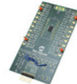
MCP43XXEV Micrel / Microchip Technology BOARD EVALUATION MCP43XX