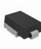
SM8S36ATHE3/I Electro-Films (EFI) / Vishay TVS DIODE 36V 58.1V DO218AC