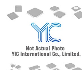
MIC5219-3.6YM5 MICREL MIC5219-3.6YM5 MICREL