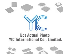
MIC5219-3.6BM5 MIC MIC5219-3.6BM5 MIC