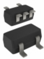
PMP4501G,115 Nexperia USA Inc. TRANS 2NPN 45V 0.1A 5TSSOP