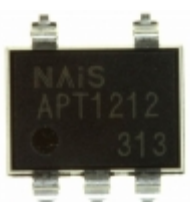
APT1212A Panasonic Electric Works OPTOISOLATOR 5KV TRIAC 6SMD