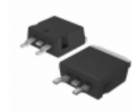
T1235T-8G STMicroelectronics THYRISTORS (SCR) AND AC SWITCHES