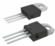
T1235T-8R STMicroelectronics THYRISTORS (SCR) AND AC SWITCHES