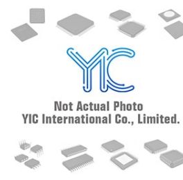
UMZ4.7K ROHM UMZ4.7K ROHM