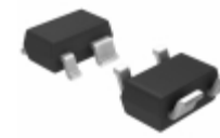
UMZ5.6KFHTL LAPIS Semiconductor ZENER DIODE (AEC-Q101 QUALIFIED)