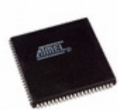
ATF1504ASL-20JC84 Microchip Technology IC CPLD 64MC 20NS 84PLCC