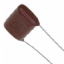
ECQ-P4563JU Panasonic Electronic Components CAP FILM 0.056UF 5% 400VDC RAD