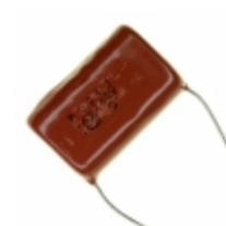
ECQ-P4394JU Panasonic Electronic Components CAP FILM 0.39UF 5% 400VDC RADIAL