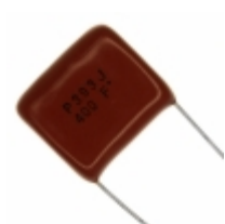
ECQ-P4393JU Panasonic Electronic Components CAP FILM 0.039UF 5% 400VDC RAD