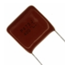
ECQ-P4473JU Panasonic Electronic Components CAP FILM 0.047UF 5% 400VDC RAD