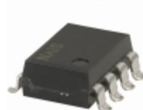
AQW284EHA Panasonic RELAY OPTO AC/DC 400V 100MA 8SMD