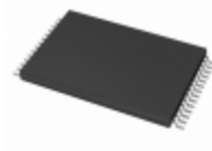
AT28C256E-15TC Microchip Technology IC EEPROM 256KBIT 150NS 28TSOP