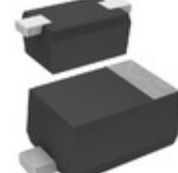
DA2S10100L Panasonic Electronic Components DIODE GEN PURP 80V 100MA SSMINI2