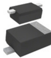
DA2JF8100L Panasonic Electronic Components DIODE GEN PURP 800V 200MA SMINI2