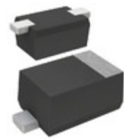
DA2S00100L Panasonic Electronic Components RF DIODE 40V 100MA SSMINI2