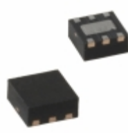
MIC5305-4.75BML-TR Microchip Technology IC REG LDO 4.75V 0.15A 6MLF