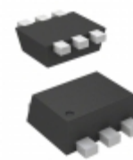
CMLD6263 TR Central Semiconductor Corp DIODE SCHOTTKY 70V 15MA SOT563