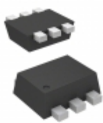
CMLD6263S TR TIN/LEAD Central Semiconductor DIODE SCHOTTKY 70V 15MA SOT563