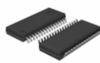
BD3487FS-E2 Rohm Semiconductor IC SOUND PROCESSOR 32-SSOP