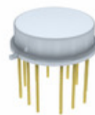
AD841KH Analog Devices Inc. IC OPAMP GP 40MHZ TO8-12