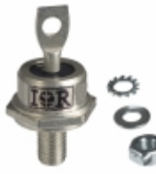
VS-1N3767 Electro-Films (EFI) / Vishay DIODE GEN PURP 900V 35A DO203AB