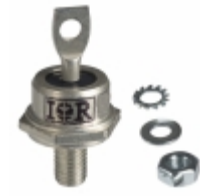
VS-1N3768R Electro-Films (EFI) / Vishay DIODE GEN PURP 1KV 35A DO203AB