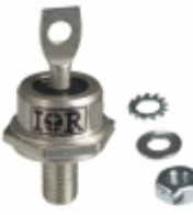
VS-1N3768R Vishay Semiconductor Diodes Division DIODE GEN PURP 1KV 35A DO203AB