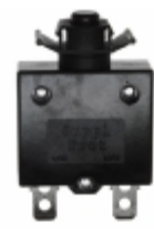
QLB-033-00DNN-3BA Qualtek CIR BRKR THRM 3A 250VAC 32VDC