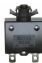
QLB-073-00DNN-3BA Qualtek CIR BRKR THRM 7A 250VAC 32VDC