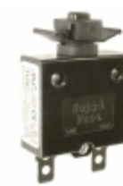
QLB-103-00DNN-3BA Qualtek CIR BRKR THRM 10A 250VAC 32VDC