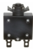
QLB-203-00DNN-3BA Qualtek CIR BRKR THRM 20A 250VAC 32VDC