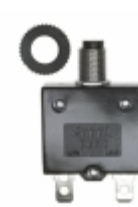
QLB-153-11B3N-3BA Qualtek CIR BRKR THRM 15A 250VAC 32VDC