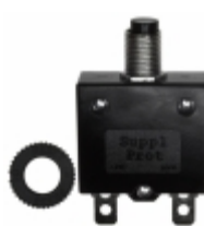
QLB-073-11B3N-3BA Qualtek CIR BRKR THRM 7A 250VAC 32VDC