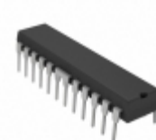
A3959SB-T Allegro MicroSystems, LLC IC MOTOR DRIVER PAR 24DIP