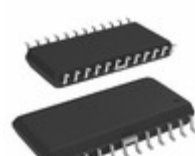
A3959SLBTR Allegro MicroSystems, LLC IC MOTOR DRIVER PAR 24SOIC