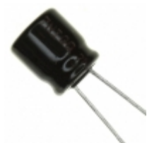
ECE-A1EKA330I Panasonic Electronic Components CAP ALUM 33UF 20% 25V RADIAL