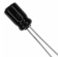
ECE-A1EKA4R7I Panasonic Electronic Components CAP ALUM 4.7UF 20% 25V RADIAL