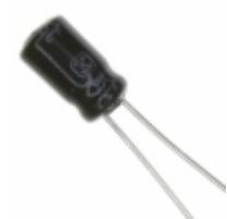
ECE-A1EKA4R7 Panasonic Electronic Components CAP ALUM 4.7UF 20% 25V RADIAL