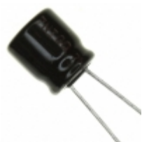
ECE-A1EKA470B Panasonic Electronic Components CAP ALUM 47UF 20% 25V RADIAL