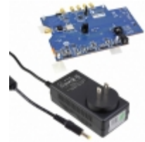
AD9625-2.5EBZ ADI (Analog Devices, Inc.) EVAL BOARD FOR AD9625-2.5