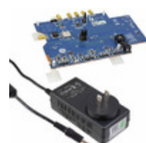
AD9625-2.0EBZ ADI (Analog Devices, Inc.) BOARD EVAL AD9625-2.0