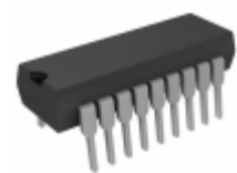
PIC16C58B-20/P Microchip Technology IC MCU 8BIT 3KB OTP 18DIP