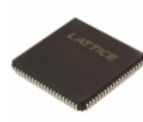
ISPLSI 2064A-80LJN84I Lattice Semiconductor Corporation IC CPLD 64MC 15NS 84PLCC