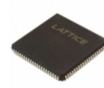
ISPLSI 2064A-125LJN84 Lattice Semiconductor Corporation IC CPLD 64MC 7.5NS 84PLCC