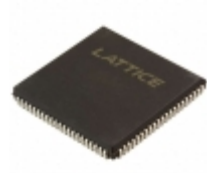
ISPLSI 2064A-80LJ84I Lattice Semiconductor Corporation IC CPLD 64MC 15NS 84PLCC